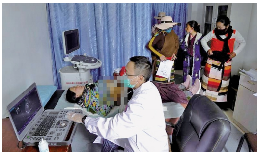
“超女来了”团队医生志愿者为藏族同胞做腹部B超

7月27日一早，嘉黎县人民医院里就排起了长队，听说温州来了一群大专家，当地百姓纷纷赶来求医问药。